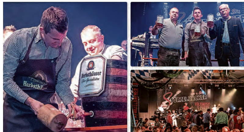
Impressionen Wert-Wies'n 2019.

Am zweiten Oktober-Wochenende wird es zünftig in Künzelsau: Die Wert-Wies'n werden von bisher zwei auf vier Veranstaltungstage vom 6. bis 9. Oktober 2022 erweitert. Erstmals wird auch während des beliebten Volksfestes ein Vergnügungspark auf dem Wertwiesen-Festgelände in Betrieb sein.