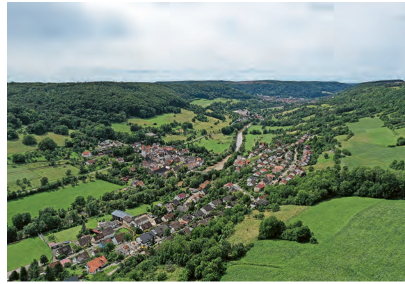
Gefördert werden u. a. Projekte, die Ortskerne erhalten, zeitgemäßes Wohnen und Arbeiten ermöglichen. Foto: Blick auf Morsbach, stimme.tv.

dende Baustoffe im Tragwerk wie zum Beispiel Holz einsetzt, kann grundsätzlich einen Förderzu-