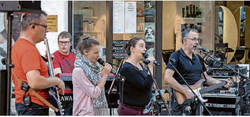
Die Band New Discovery am 7. Juli bei „Sommer in der Stadt“

Sich informieren, wo noch Ausbildungsplätze zu haben sind und danach den Tag gemütlich ausklingen lassen – das lässt sich ohne großen Aufwand oder Anmeldung am Donnerstag, 7. Juli 2022 in Künzelsau machen. Bei der Last-Minute-Ausbildungsaktion präsentieren 18 Unternehmen, wie ein Start ins Berufsleben aussehen kann. Flotte Live-Musik hat die Band New Discovery im Angebot. In der Keltergasse sorgen die Musiker für Sommerfeeling. Künzelsauer Gastronomiebetriebe bewirten auch beim dritten Abend der Sommer-in-der-Stadt-Reihe. Der Eintritt ist frei.