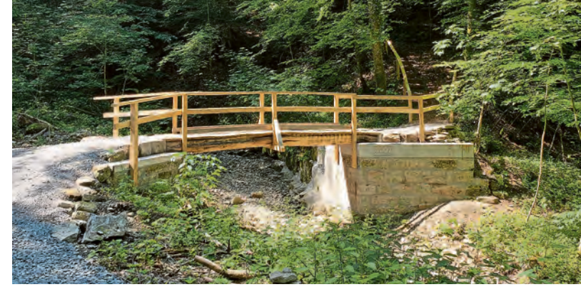
Unterstützt mit Mitteln aus dem Künzelsauer Bürgerbudget und einer Abstecher wert: das historische und vom SC Kocherstetten wieder neu aufgebaute Lügenbrücke im Wald bei Kocherstetten.

Eine vorherige Anmeldung zur Sprechstunde ist erforderlich per E-Mail an buergerbudget@kuenzelsau.de .